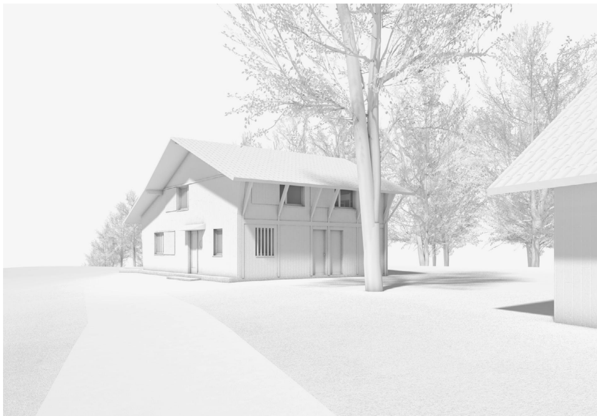
Ersatzneubau Alp Rittmarren

An der Ortsbürgerversammlung vom 14. April 2022 stimmte die Bürgerschaft ohne Gegenstimme dem Projekt zu und ermächtigte den Ortsverwaltungsrat, das Projekt Ersatzneubau Alp Rittmarren zu realisieren. Das Baugesuch wurde am 30. Juni 2023 bei der Bauverwaltung der Politischen Gemeinde Gommiswald eingereicht. Während vierzehn Tagen vom 4. bis 17. Oktober 2023 wurde das Baugesuch öffentlich aufgelegt. Gegen das geplante Projekt erfolgten keine Einsprachen. Da das Bauvorhaben ausserhalb der Bauzone liegt, ist der Kanton für die Baubewilligung zuständig.