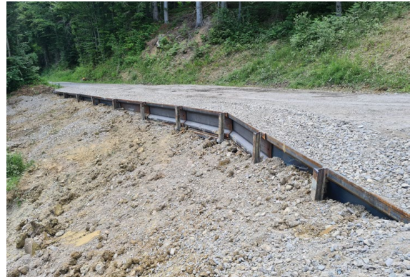
Sanierung Dürrtannstrasse «Ribbertverbauung»

Projektperimeter geschaffen. So konnten innere Waldränder angelegt werden, was zur Stabilität beiträgt und den Wuchs der Weisstannen fördert. Diese benötigt das Auerwild als Nahrung im Winter und als Sitzbaum.