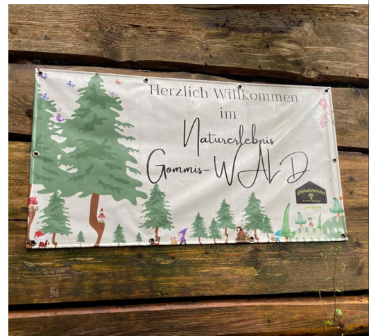
Besichtigung des «Angebot Naturerlebnis Gommis-WALD» durch GPK und Ortsverwaltungsrat.