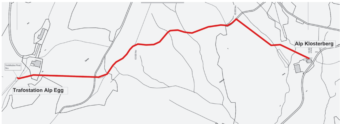
Abbildung 1 Linienführung Trafostation Alp Egg zu Alp Klosterberg

Jahr 2023 durch die Bürgerschaft wurde die Ausarbeitung des Projektes angestossen. Die Baubewilligung wurde am 16. November 2023 erteilt und ist am 30. November 2023 der Rechtskraft erwachsen. Der Baustart ist, unter Vorbehalt des Entscheides der Bürgerschaft, auf anfangs Mai 2024 vorgesehen.