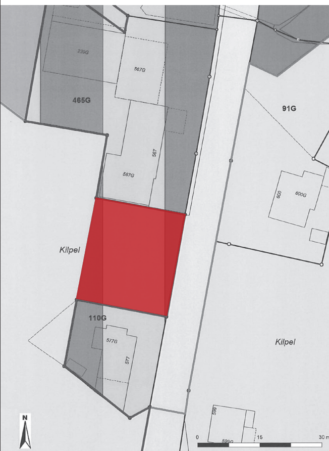
Bauparzelle Chilpel, Wohn Gewerbe Zone ca. 545 \text{ m}^2

Auf dem Grundstück ist der Neubau eines Wohnhauses geplant. Damit dieses Bauprojekt realisiert werden kann und die vorgeschriebenen Grenzabstände gegenüber dem Grundstück Nr. 109 nicht