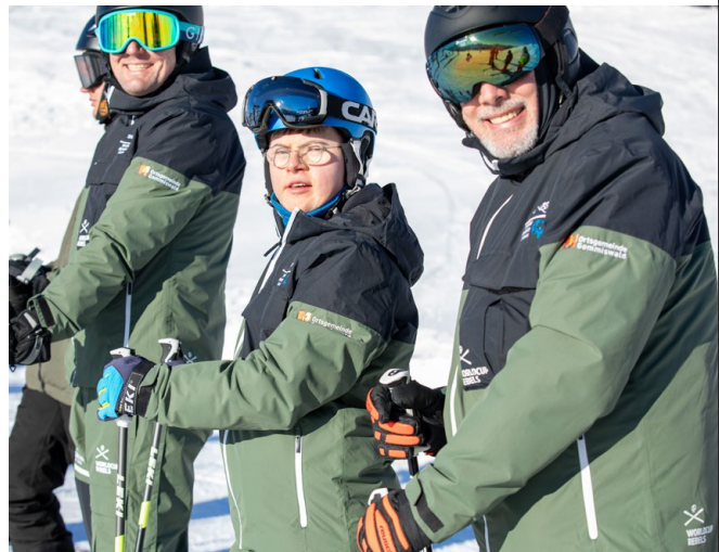
Sponsoring Teambekleidung Wintersportgruppe insieme Rapperswil-Jona

Im Jahr 2023 wurden Total CHF 52 000.- für die Allgemeinheit ausgegeben. Finanziell wurden über 30 Vereine und Institutionen unterstützt.